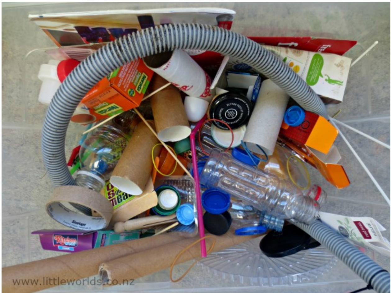
Caja de Inventor, lleno de piezas sueltas reciclados que se pueden utilizar para crear casi cualquier cosa.