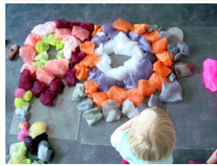
exploraciones de bolas de hojaldré.

Un lugar significativo e inspirador . Buscar un lugar maravilloso para la exploración maravillosa. Considere inesperados, incidentales, lugares, así como los lugares habituales, como el centro de reciclaje, la esquina desordenado, o el estudio. Los niños podrían encontrar y explorar objetos y materiales en los que brilla la luz natural y rebotes, una ventana enmarca una vista, o una sobrecarga de los flotadores móvil. Lugares deben estar fuera del tráfico y orientada lejos de las distracciones. Un niño podría encontrar objetos interesantes sobre una mesa de luz en una zona tranquila, en una "tabla de historia", distribuido bajo una rama suspendida, o en un hueco. Añadir espejos para los niños a verse a sí mismos y sus creaciones desde diferentes perspectivas.