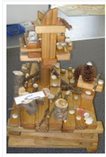
Casas y castillos

Hay tablas de clip y papel, lápices y marcadores negros disponibles para los niños y les animan a diseñar lo que se va a construir. Esto ha demostrado ser especialmente útil cuando un grupo de niños están trabajando juntos como el dibujo ayuda a comunicar las ideas de todos y permite que cada niño escoja una parte particular de la construcción para trabajar. Los niños también utilizan estos materiales para hacer señales para sus construcciones.