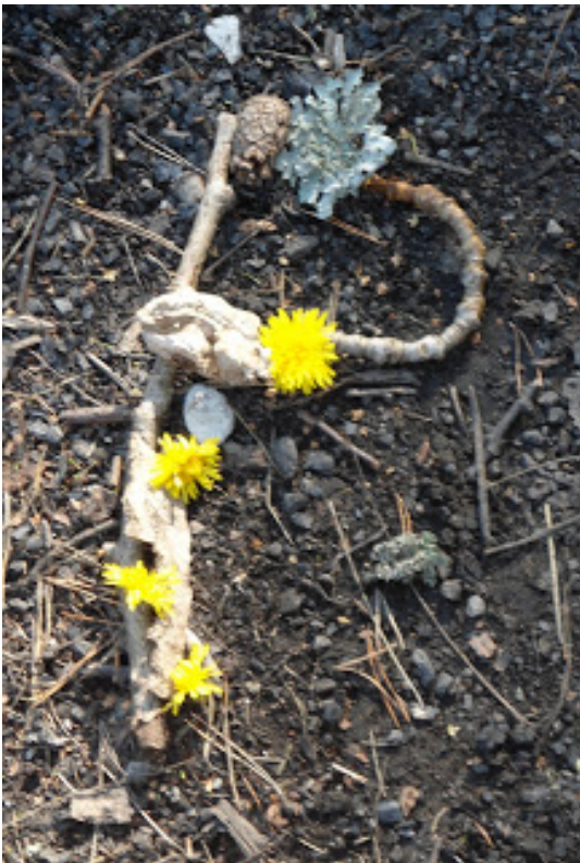
Yo quería que mi carta al mirador sobre el lago ...