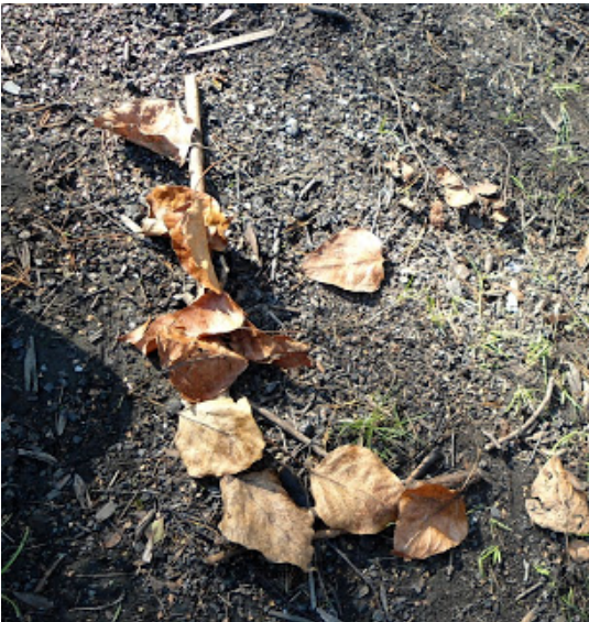
Paulina quería hacer su carta bastante!