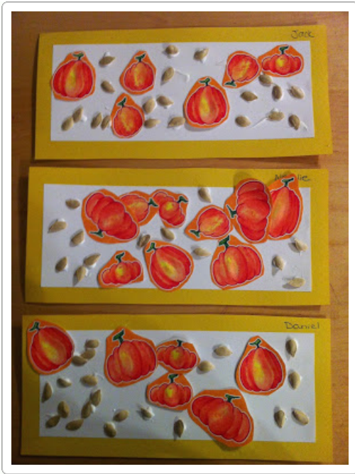
por: Carrie Home Daycare

Nos recogió las semillas de una calabaza, lavado y secado, entonces hicieron este collage! Calabazas se cortan de una hoja de papel 12x12 álbum de recortes.