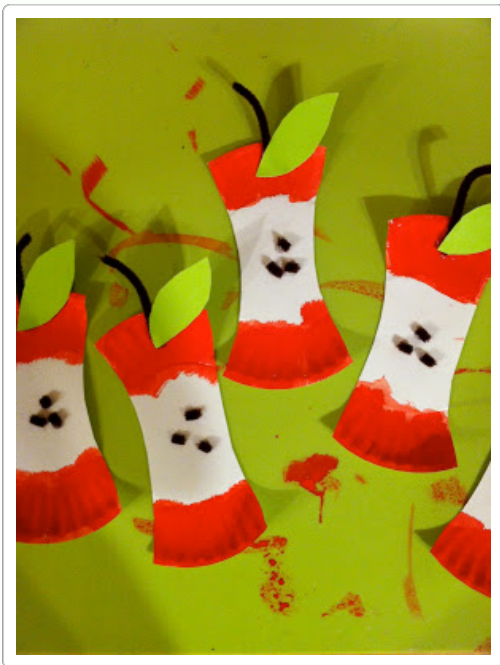
por: Carrie Home Daycare

Utilizamos pequeños platos de papel, papel verde, limpia pipas, una pistola de pegamento caliente y pintura roja para este proyecto.