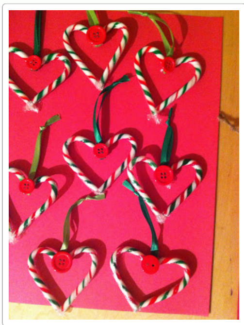
por: Carrie Home Daycare

pegamento caliente dos mini bastones de caramelo juntos. Añadir botón y la cinta para volver a crear estos ornamentos lindos!