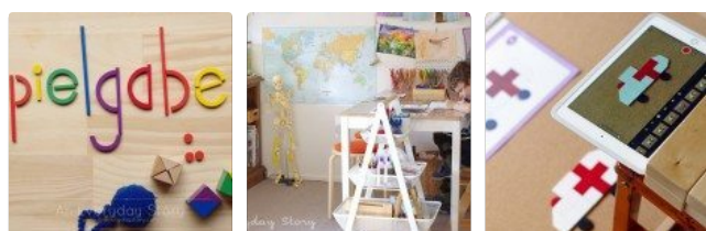
Comentario: Spielgaben - ¿Vale la pena el dinero?