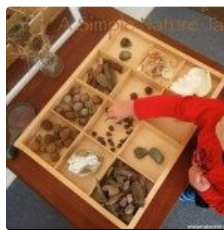
No es sólo un palo: Una tabla simple naturaleza