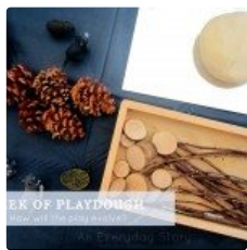
Una semana de plastilina