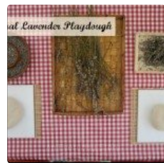
Natural Lavanda Playdough