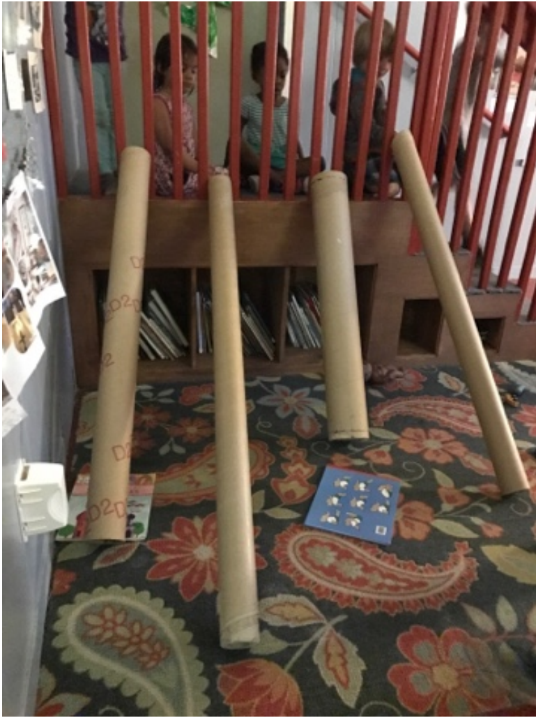
[ https://lh3.googleusercontent.com/-wSwCgjHf7iU/WO5u_rfsDwI/AAAAAAAAj2o/tWRk3W4YFcw/s640/blogger-image-1547005664.jpg ]